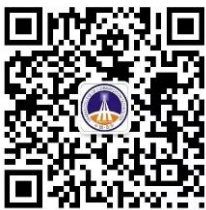
陕西交院后勤服务平台