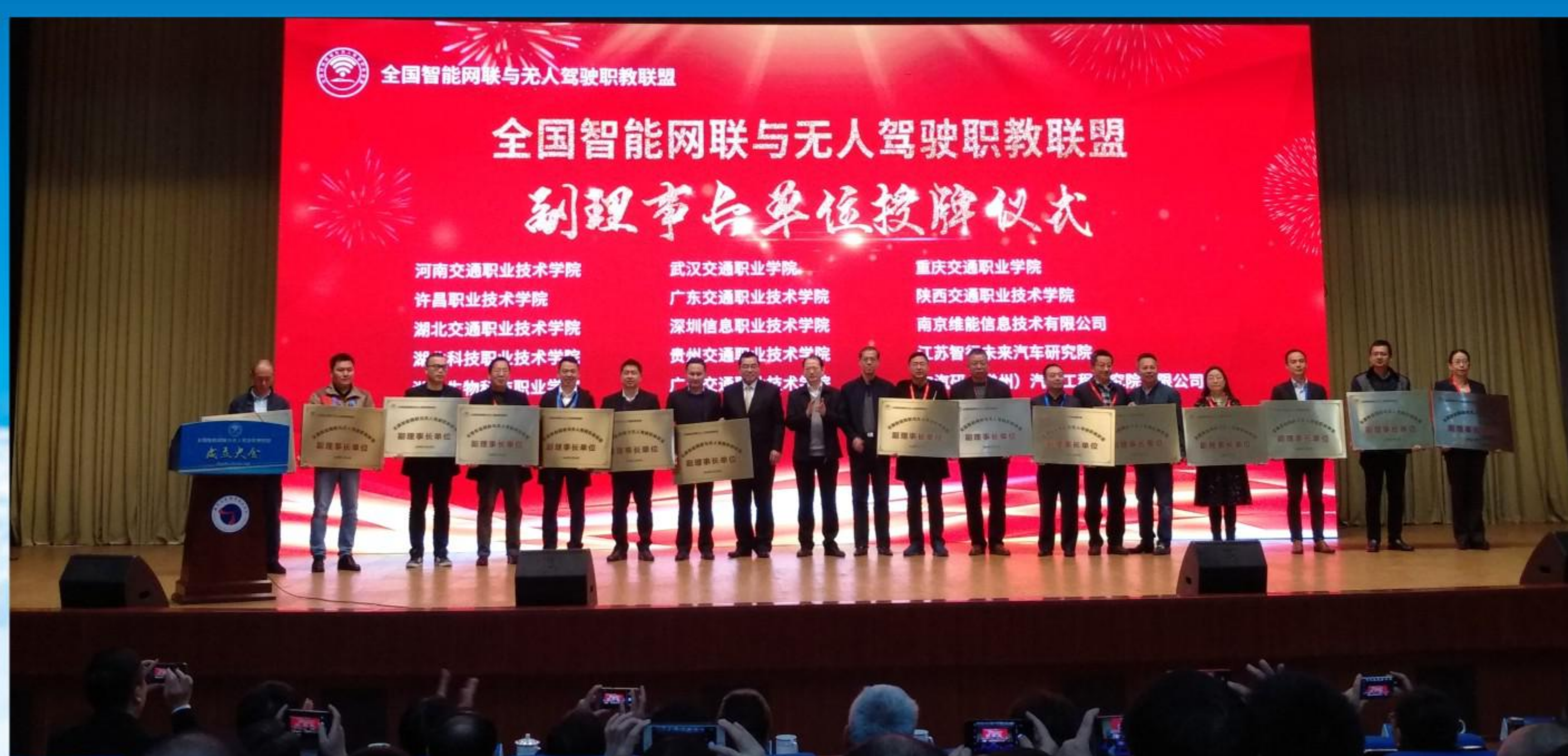
我校是全国智能网联与无人驾驶职教联盟副理事长单位