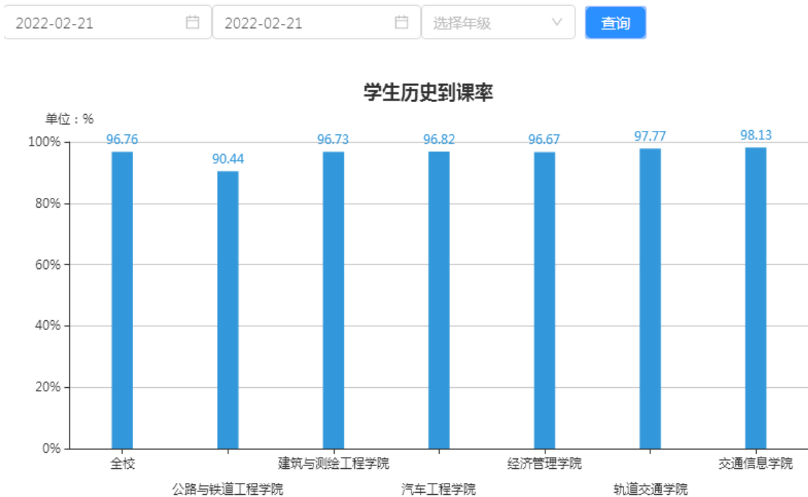
图 3 开学第一天学生到课率截图

开学第一天，数字课堂手机端运行正常，师生使用该 APP 签到，进行实时考勤。管理端数据监控显示，学生实时到课情况较好，第一天学生平均到课率 96.76%，与去年同期持平，详见图 3。