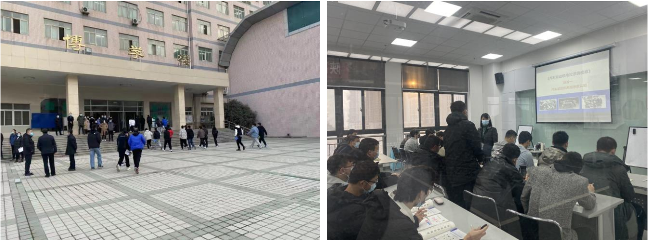
图 2 同学们有序进入教学楼、开学第一课秩序井然

开学第一天，数字课堂手机端运行正常，师生使用该 APP 签到，进行实时考勤。管理端数据监控显示，学生实时到课情况较好，第一天学生平均到课率 96.76%，与去年同期持平，详见图 3。