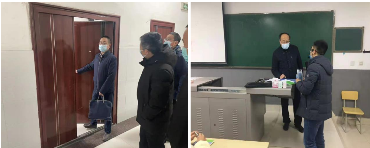
图 1 校领导带队检查开学第一天上课情况

全校师生高度重视开学第一堂课。在教学过程中，教师有效融入疫情防控、健康生命教育、爱国卫生教育等思政元素，切实落实好开学第一课任务。全校提前完成教室、计算机实训中心教学设备的维护检修及教室环境的清洁消杀，师生均能提前到达教室，使用手机数字课堂 APP 进行签到、考勤。整体教学运行有序顺畅，第一节课无教师迟到现象发生，按时上下课。大部分学生能够按要求佩戴口罩、携带教材和笔记本，积极参加教学活动。根据各学院返校学生统计上报数据，开学第一天全校学生到校率 96.4%，总体开局情况良好。